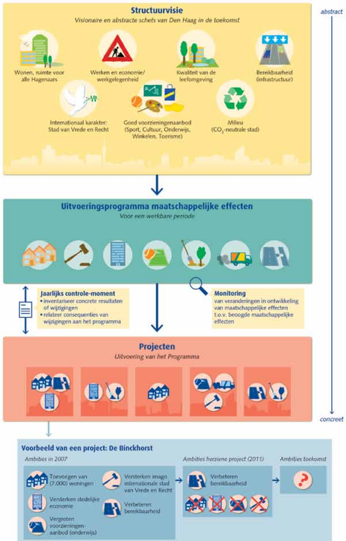
Figuur 1. Voorbeeld van een doelenboom