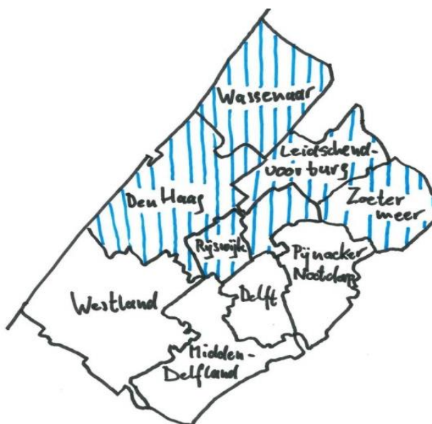
Figuur 2. Haaglanden regio en Maatschappelijke opvang regio (laatste gearceerd in blauw).

De gemeente Den Haag is de centrumgemeente voor de regio die samenwerkt bij het uitvoeren van maatschappelijke opvang. Binnen het college van burgemeester en wethouders is de maatschappelijke opvang de verantwoordelijkheid van wethouder Stedelijke Economie, Zorg en Havens en stadsdeel Scheveningen (SEZH). De dienst OCW is verantwoordelijk voor de integrale uitvoering van de Wmo en daarmee ook voor maatschappelijke opvang. In de toegang en ketenregie van de maatschappelijke opvang heeft het Centraal Coördinatie Punt (CCP) de centrale rol. Met het CCP voert de gemeente Den Haag haar verantwoordelijkheid uit als centrumgemeente in de samenwerkingsregio voor maatschappelijke opvang. Onder deze samenwerkingsregio vallen de volgende vijf gemeenten: Den Haag, Leidschendam – Voorburg, Rijswijk, Wassenaar en Zoetermeer (zie figuur 2). Het CCP is een onderdeel van de GGD, een onderdeel van de dienst OCW. De GGD is de uitvoeringsorganisatie van de GGD Haaglanden, een gemeenschappelijke regeling van in totaal 9 gemeenten in de regio (zie figuur 2). Deze uitvoeringsorganisatie voert zowel taken uit voor de 9 gemeenten uit de gemeenschappelijke regeling, als voor afzonderlijke deelnemers in de regeling. Eén van deze lokale taken is de uitvoering van het CCP in Den Haag als centrumgemeente in de samenwerkingsregio.