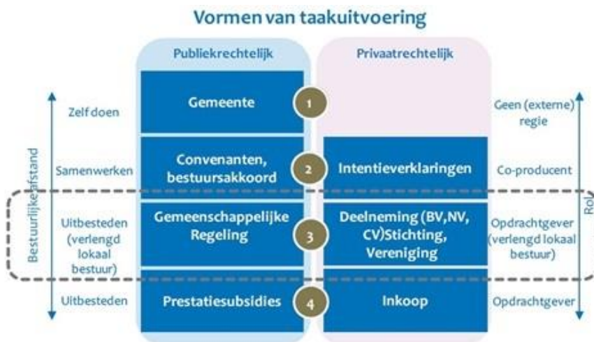
Figuur 1: Vormen van taakuitvoering 3

Het uitvoeren van gemeentelijke taken kan op een aantal manieren worden ingericht. De gemeente kan het volledig zelf doen, kiezen voor een vorm van samenwerking of uitbesteden. 1 De keuze voor een bepaalde wijze van taakuitvoering wordt ingegeven door de opvatting dat deze manier de meest geëigende vorm is om het gemeentelijke beleid en ambities te helpen realiseren en/of de lokale belangen te borgen. Een specifieke vorm van samenwerking betreffen verbonden partijen (in figuur 1 is dat niveau 3). Verbonden partijen zijn privaatrechtelijke of publiekrechtelijke organisaties waarin de gemeente een bestuurlijk en een financieel belang heeft. 2 Een verbonden partij kan in verschillende vormen bestaan zoals o.a. een (verplichte) gemeentelijke regeling, een vennootschap of een stichting.